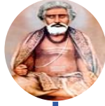
कामेश्वरानन्द नाथ / कामेश्वर्यम्बा