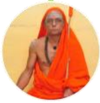
జ్ఞానానంద నాథ / జ్ఞానామ్బ