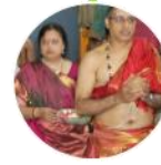
స్వభావానంద నాథ / కామేశ్వర్యమ్బ