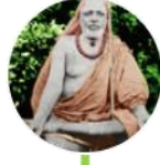
రామానంద నాథ / రామామ్బ